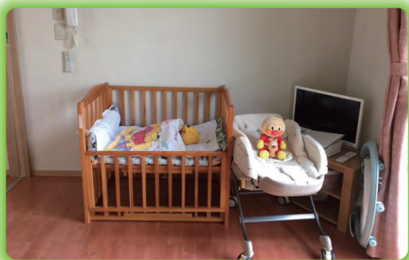
お昼寝のできる部屋